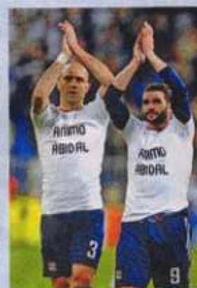
JUGADORES de otros equipos de la liga europea se solidarizaron con el defensa del equipo azul grana.