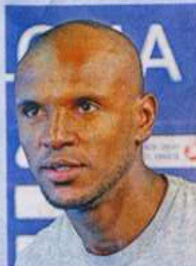
ABIDAL actualmente se recupera de una operación laparoscópica, por un tumor en el hígado. Lo darán de alta en el transcurso de esta semana.

Este jugador también fue considerado el mejor lateral izquierdo del Mundial de Alemania 2006.