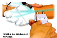
Prueba de conducción nerviosa

Para el diagnóstico es necesario realizar estudios de NC motora y sensitiva, siendo la NC sensitiva la primera en afectarse y la que nos da la pauta para distinguir la severidad de la lesión desde el inicio. La EMG de aguja se puede utilizar especialmente cuando es necesario descartar una RC, o lesión en otras partes del trayecto del