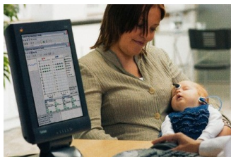
Potenciales Evocados Auditivos de Tallo Cerebral

Los Potenciales Evocados Visuales (PEV) nos evalúa la integración de toda la vía visual dando un gran aporte en lesiones que pueden aparecer en diferentes etapas de la vida, muy utilizadas en niños para determinar daños congénitos, siendo un estudio de detección temprana de lesiones en la vía visual. Es de particular interés en el estudio de la Esclerosis Múltiple, compresión del quiasma óptico por tumores hipofisarios, neuritis óptica y para diferenciar la ceguera