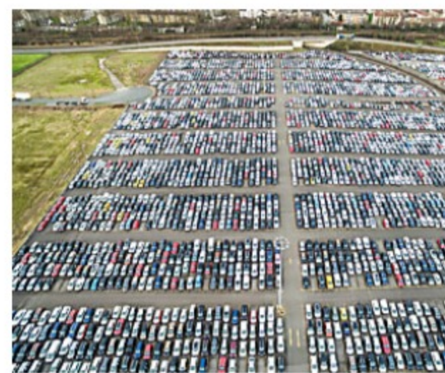
¿Por qué nadie me dijo esto sobre autos nuevos?