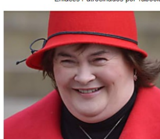
Susan Boyle Is So Skinny Now And Looks Like A Model - We Can't Stop Staring (Photos)