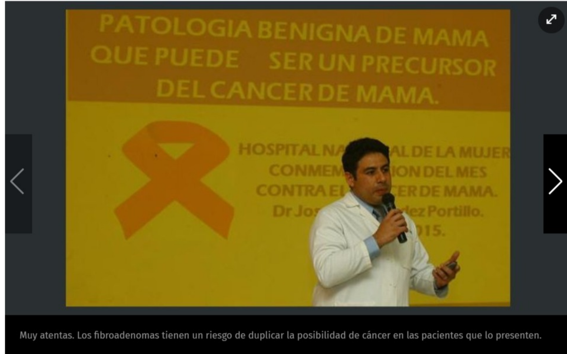
Muy atentas. Los fibroadenomas tienen un riesgo de duplicar la posibilidad de cáncer en las pacientes que lo presentan.