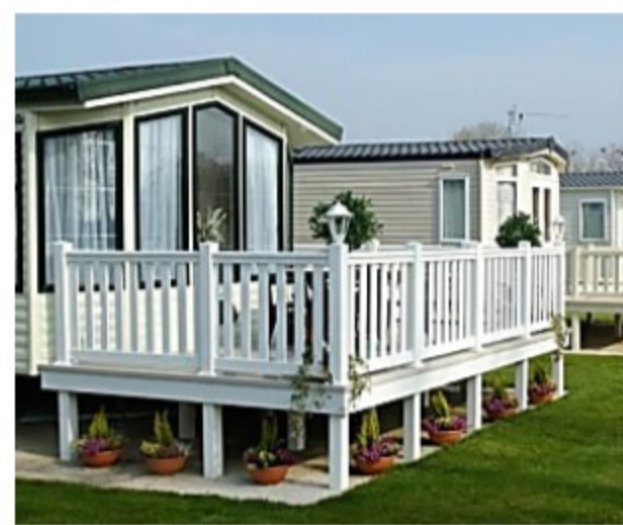
Luxury Senior Living Near Pocono Summit Is Actually Affordable. Search For Senio...