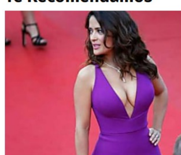
Salma Hayek No Makeup Photo Confirms The Rumors