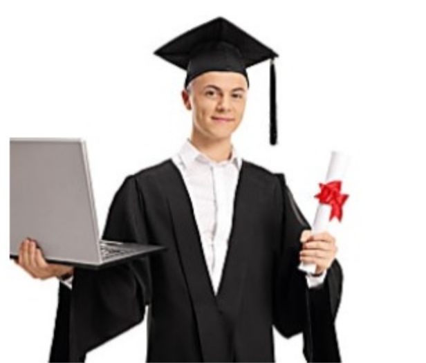
Esto es lo que debería costar un título en línea Pocono Summit