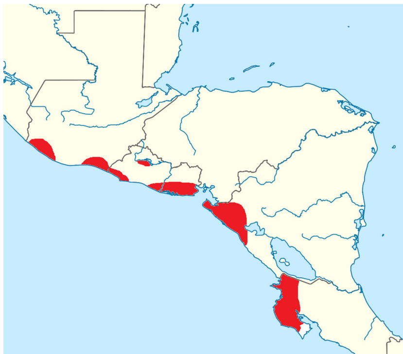
Figura 1 – Regiones en donde se ha documentado la presencia de la nefropatía mesoamericana.

recomendaciones sobre las áreas y las prioridades en investigación.